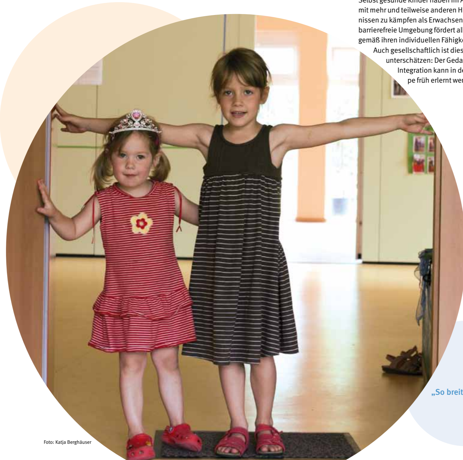
„So breit müssen barrierefreie Türen sein ...“

Informationen zu Eingliederungshilfen und Weiterbildungsmöglichkeiten für Erzieherinnen bieten Sozialämter, Frühförderstellen und Sozialpädagogische Zentren in Deutschland.