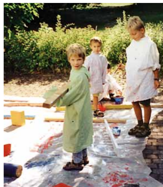
Die Kinder streichen ihren Zaun im Stil von Hundertwasser.

In einem Sinnesgarten erleben die Kinder mit Händen und Füßen, wie sich Moos, Steine, Heu und Tannenzapfen anfühlen. Zudem erleben sie aktiv die Jahreszeiten und lernen, dass sich die Natur stets verändert. Details wie Windspiele und Klangspiele in den Bäumen erfreuen die Kinder.