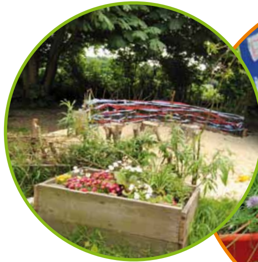
Kräuter verfeinern das Frühstück – im Tee oder als Salat.

Nadelhölzer, Lebensbäume und Kirschlorbeer sind aus unseren Gärten nicht mehr wegzudenken. Leider! Sie mögen einen ordentlichen Sichtschutz bieten und wenig pflegeintensiv sein, aber sie schaffen keine kindgerechte Atmosphäre. Insekten finden hier kaum Nahrung, Asseln, Spinnen und Schnecken keine Versteckmöglichkeit. Abwechslungsreiche Sinneserfahrungen können an einem solchen Ort nicht gesammelt